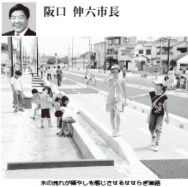
水の流れが緩やかしを添わせている歩道整備