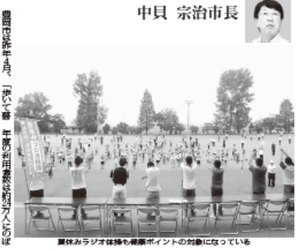
身体みラジオ体操も健康ポイントの対象になっている