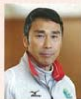
東海大学体育学部 教授 東海大学陸上競技部 監督