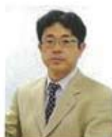
筑波大学大学院 人間総合科学研究科教授

また、NPO法人日本ランニング振興機構を立ち上げ、「日本人総アスリート計画」をビジョンに掲げ、幼児から高齢者までを対象としたランニングの普及・振興にも精力的に取り組んでいる。